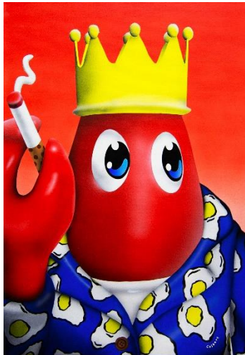
Smoking Lobster (Red) 2018 Oil and acrylic on canvas 42 x 60 cm