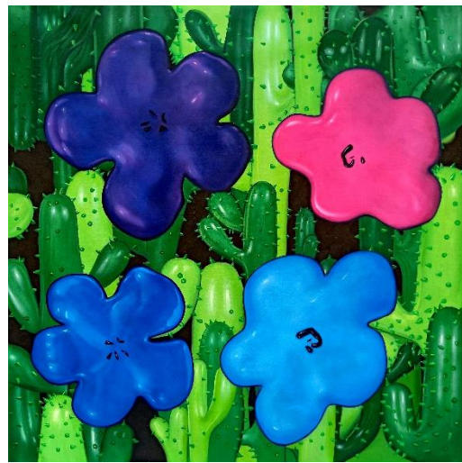
Flower Study from Lobster Land (Purple, Magenta, Blue, Light Blue) 2019 Oil and acrylic on canvas 150 x 150 cm