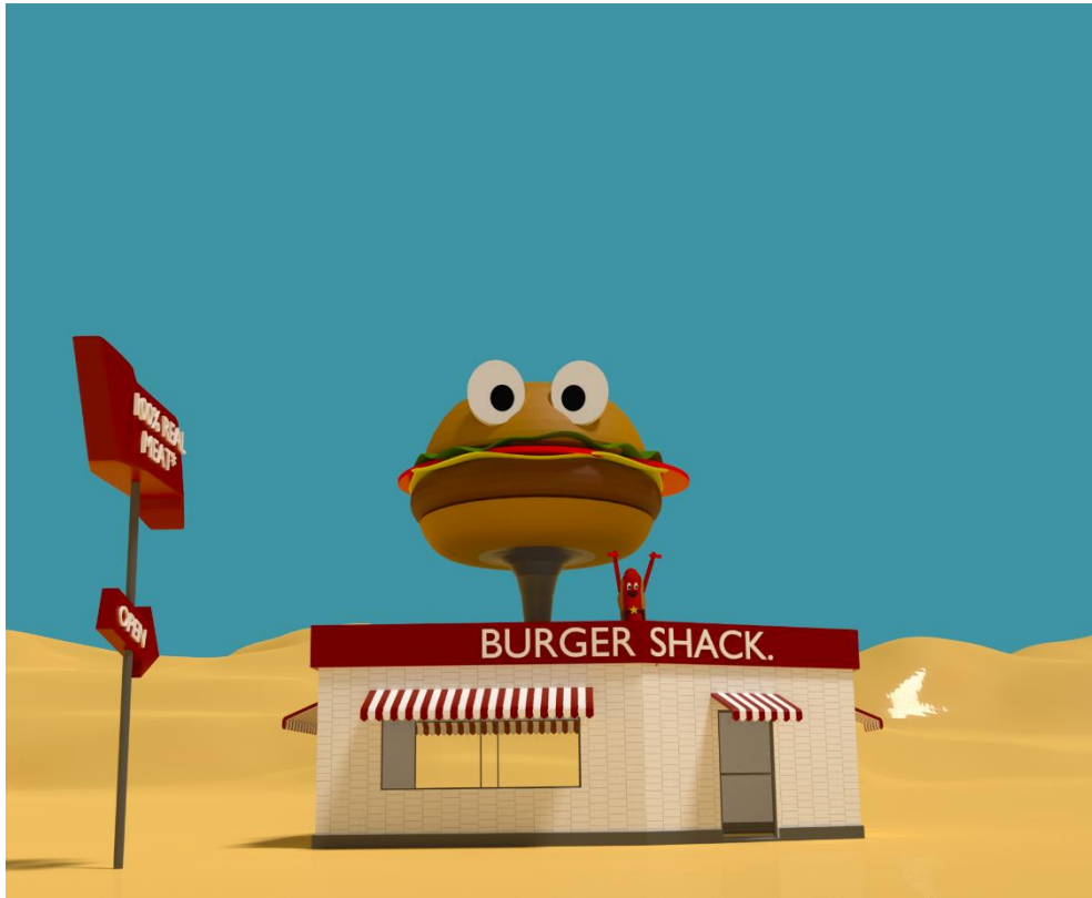
Lobster Land, 2019, Video installation