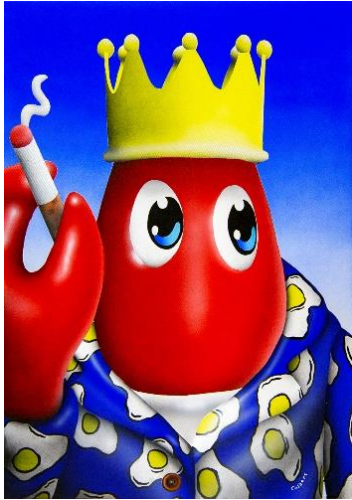
Smoking Lobster (Blue) 2018 Oil and acrylic on canvas 42 x 60 cm