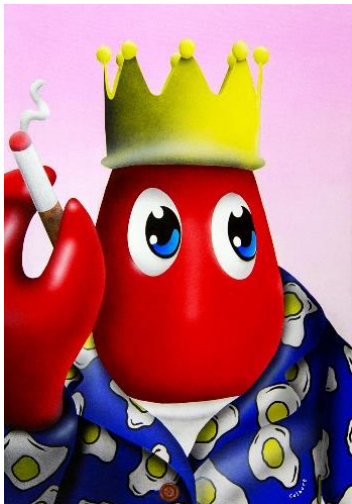
Smoking Lobster (Pink) 2018 Oil and acrylic on canvas 42 x 60 cm