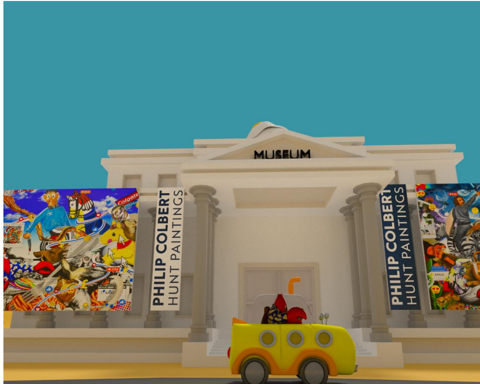
Lobster Land, 2019, Video installation