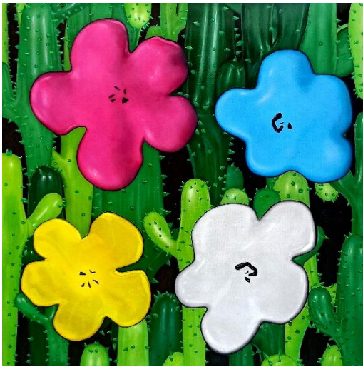
Flower Study from Lobster Land (Magenta, Light Blue, Yellow, White) 2019 Oil and acrylic on canvas 150 x 150 cm