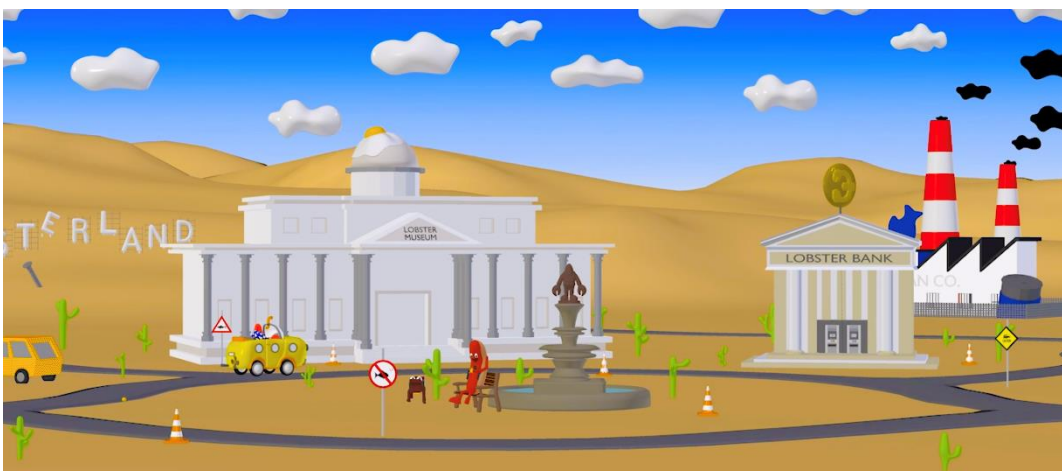
Lobster Land, 2019, Video installation