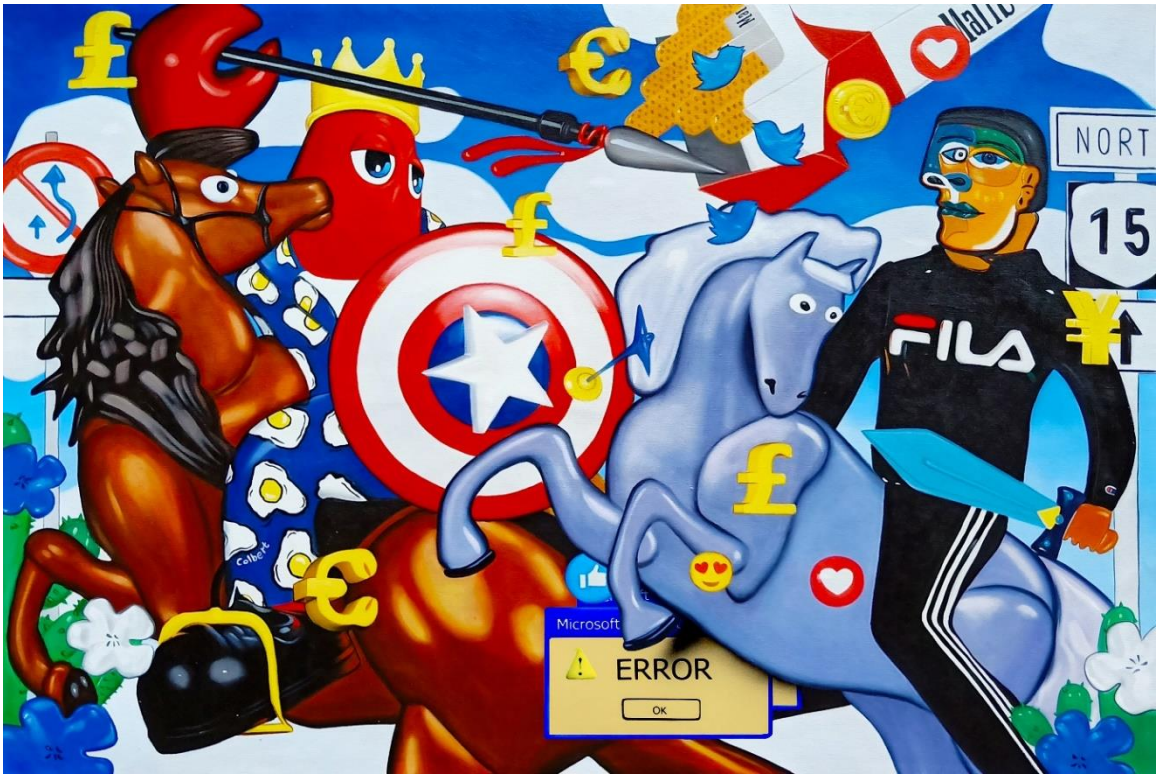
Hunt Scene II (Study), 2019, oil and acrylic on canvas, 100 x 150 cm