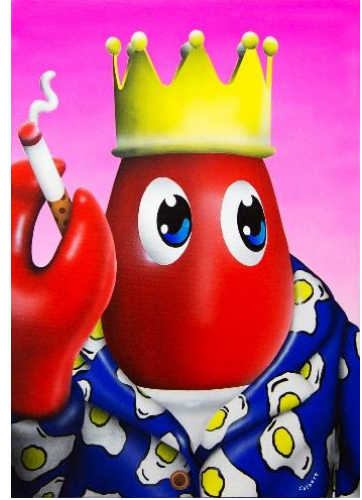
Smoking Lobster (Magenta) 2018 Oil and acrylic on canvas 42 x 60 cm