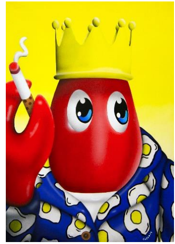
Smoking Lobster (Yellow) 2018 Oil and acrylic on canvas 42 x 60 cm