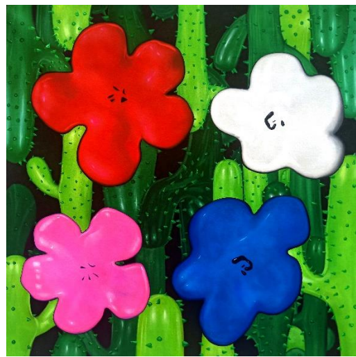
Flower Study from Lobster Land (Red, White, Magenta, Blue) 2019 Oil and acrylic on canvas 150 x 150 cm