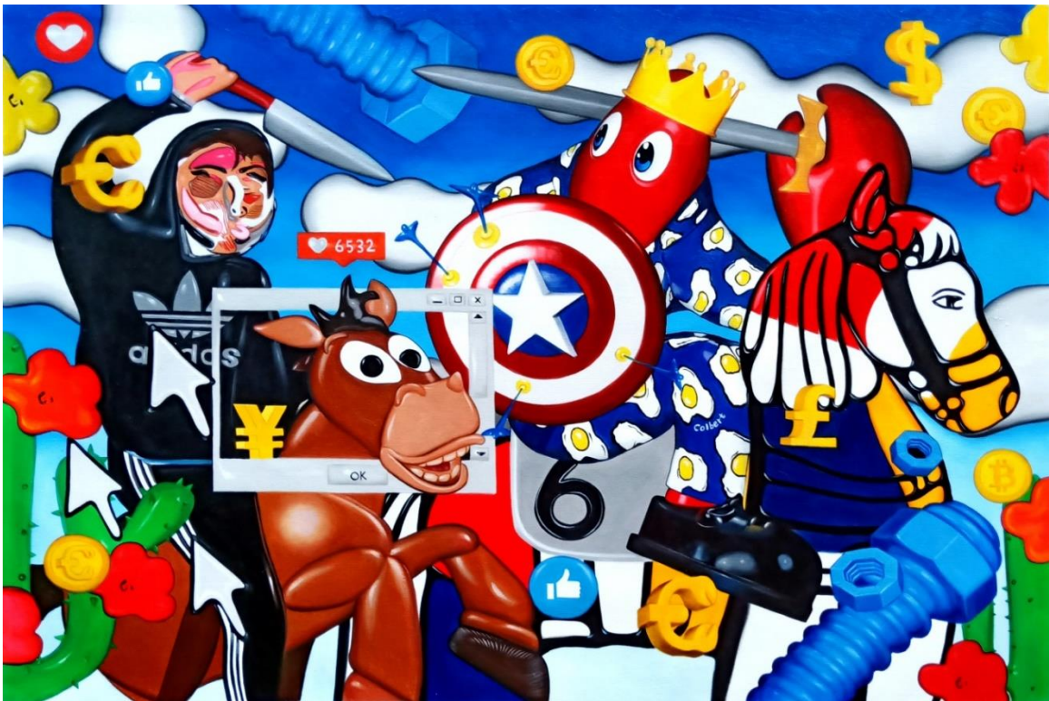
Hunt Scene VI (Study), 2019, oil and acrylic on canvas, 100 x 150 cm