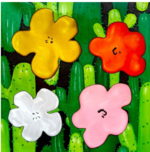
Flower Study from Lobster Land (Yellow, Orange, White, Pink) 2019 Oil and acrylic on canvas 150 x 150 cm