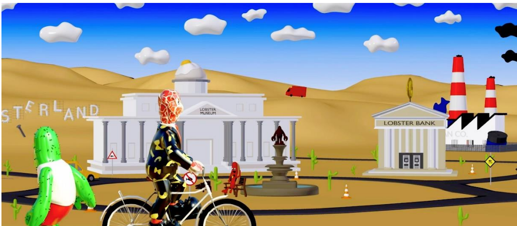
Lobster Land, 2019, Video installation