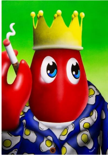
Smoking Lobster (Green) 2018 Oil and acrylic on canvas 42 x 60 cm