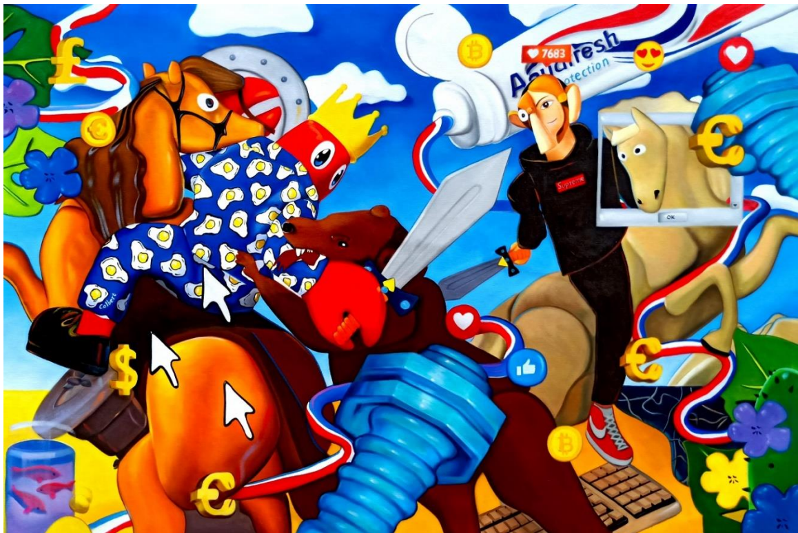
Bear Hunt II (Study), 2019, oil and acrylic on canvas, 100 x 150 cm